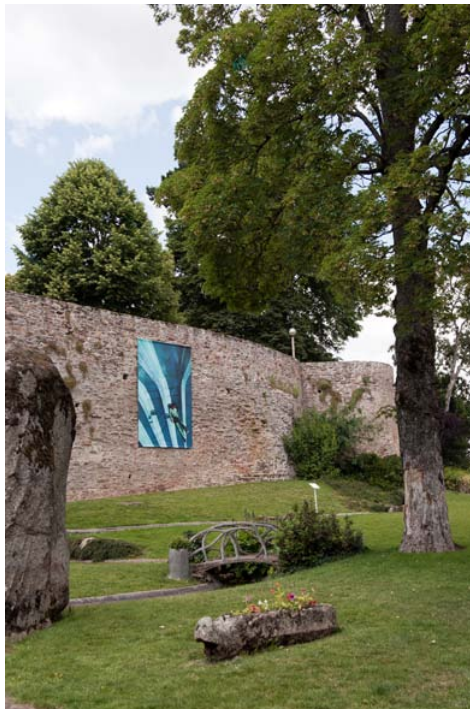
③ "Lignes de fuite" n°9 450 cm x 300 cm Jardin du Mail