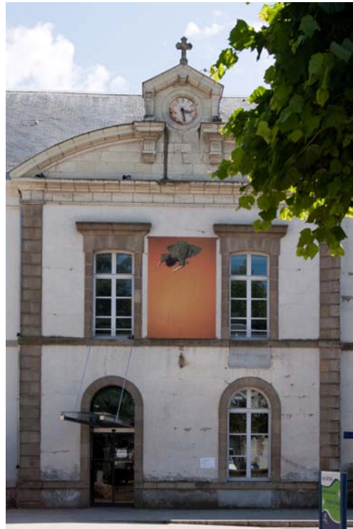
⑥ "Offrande" 300 cm x 200 cm Espace Saint-Louis