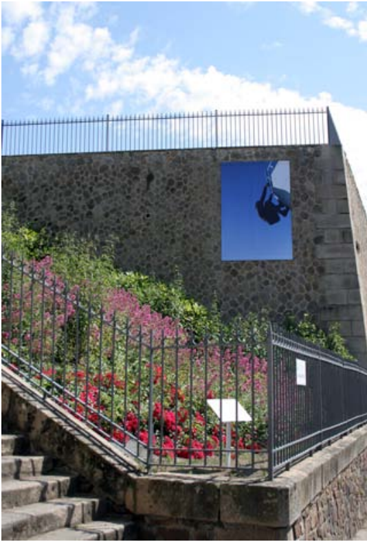
⑤ "Eden Roc" 270 cm x 180 cm Jardin du Mail