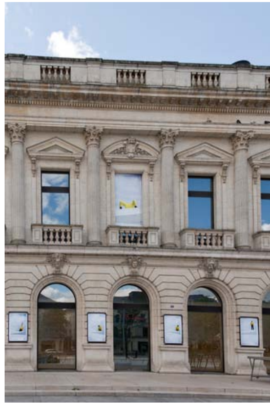
① "Lignes de fuite" n°1 315 cm x 147 cm Place Travot / Installation avec 4 panneaux d'affichage