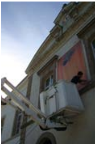
Installation de "Offrande"