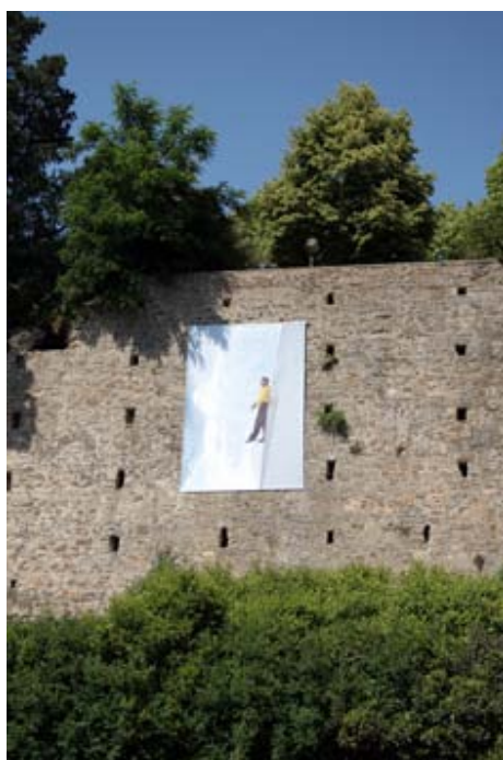
④ "Lignes de fuite" n°3 450 cm x 300 cm Jardin du Mail Avenue de l'Abreuvoir